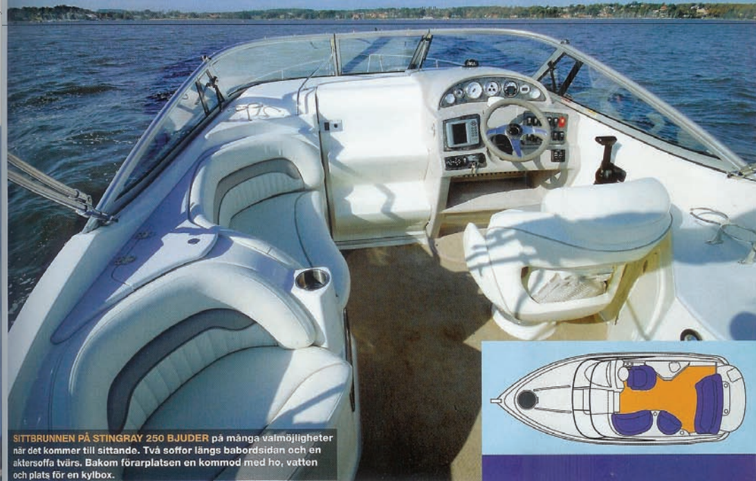
SITTRUNNEN PÅ STINGRAY 250 BJUDER på många valmöjligheter när det kommer till sittande. Två soffor längs babordsidan och en aktersoffa tvärs. Bakom förarplatsen en kommod med ho, vatten och plats för en kylbox.

»TROTS ATT BÅTEN HAR ETT RELATIVT TUNGT GÅNGLÄGE MED MYCKET AV BOTTEN I VATTNET GÅR DEN MJUKT ÄVEN I KRABB SJÖ.«