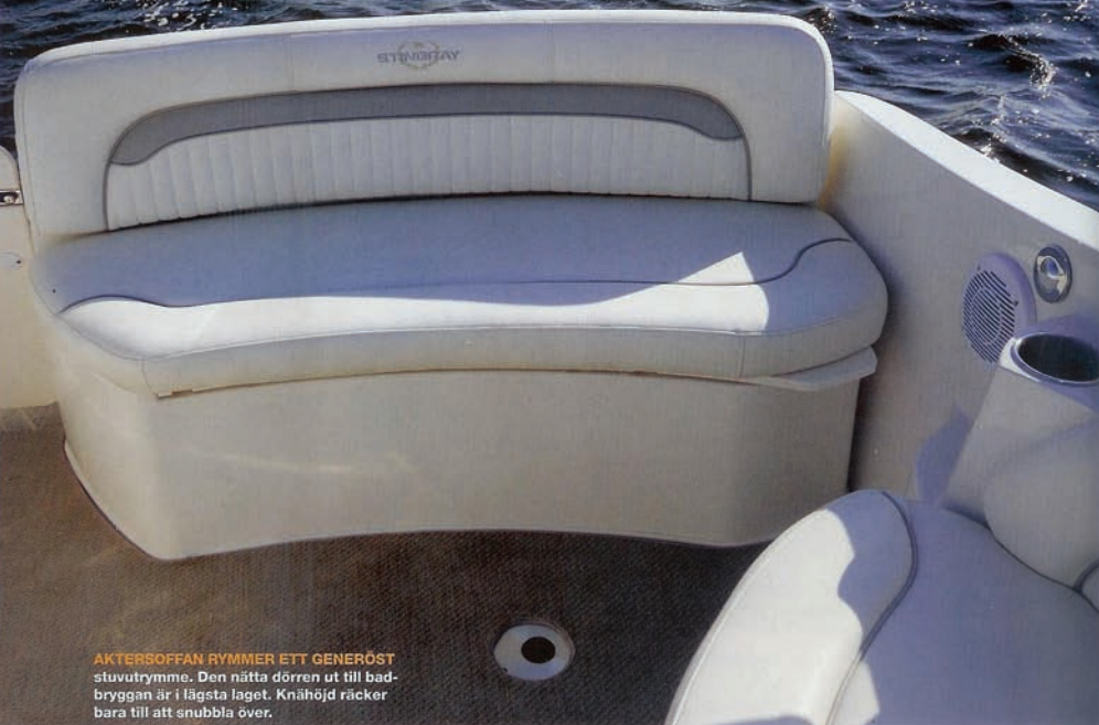
AKTERSOFFAN RYMMER ETT GENERÖST stuvutrymme. Den nätta dörren ut till badbryggan är i lägsta laget. Knähöjd räcker bara till att snubbla över.

vind upp. Utanför piren börjar de vita gässkammarna växa till sig. Bilturen har gett mig ostadiga ben och jag går bredbent ut på bryggan.