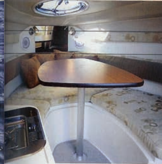
LJUSA TEXTILIER I KOMBINATION med gott om ljusinsläpp ger rymd åt den annars ganska trånga ruffen. Toaletten om styrbord och pentryt på babordsidan. Ståhöjd? Icke.

»RESTEN AV YTORNA ÄR, PÅ AMERIKANSKT VIS, TILLÄGNADE ETT GENERÖST ANTAL BURK OCH GLASHÄLLARE.«